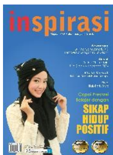
SMAM 1 Gresik