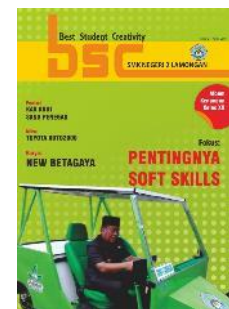
SMKN 2 Lamongan