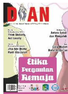
SMKN 1 Pamekasan