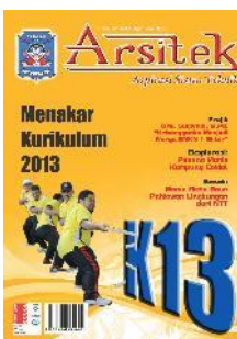
SMKN 1 Blitar