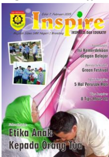
SMKN 1 Paciran