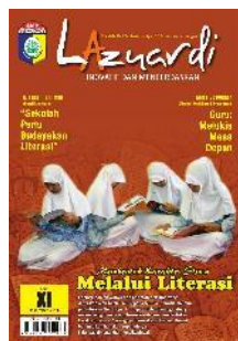
SMPM 15 Lamongan