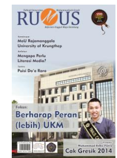
Univ. Muh Gresik