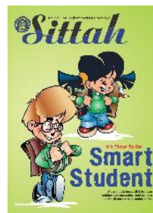
SMPM 6 Surabaya